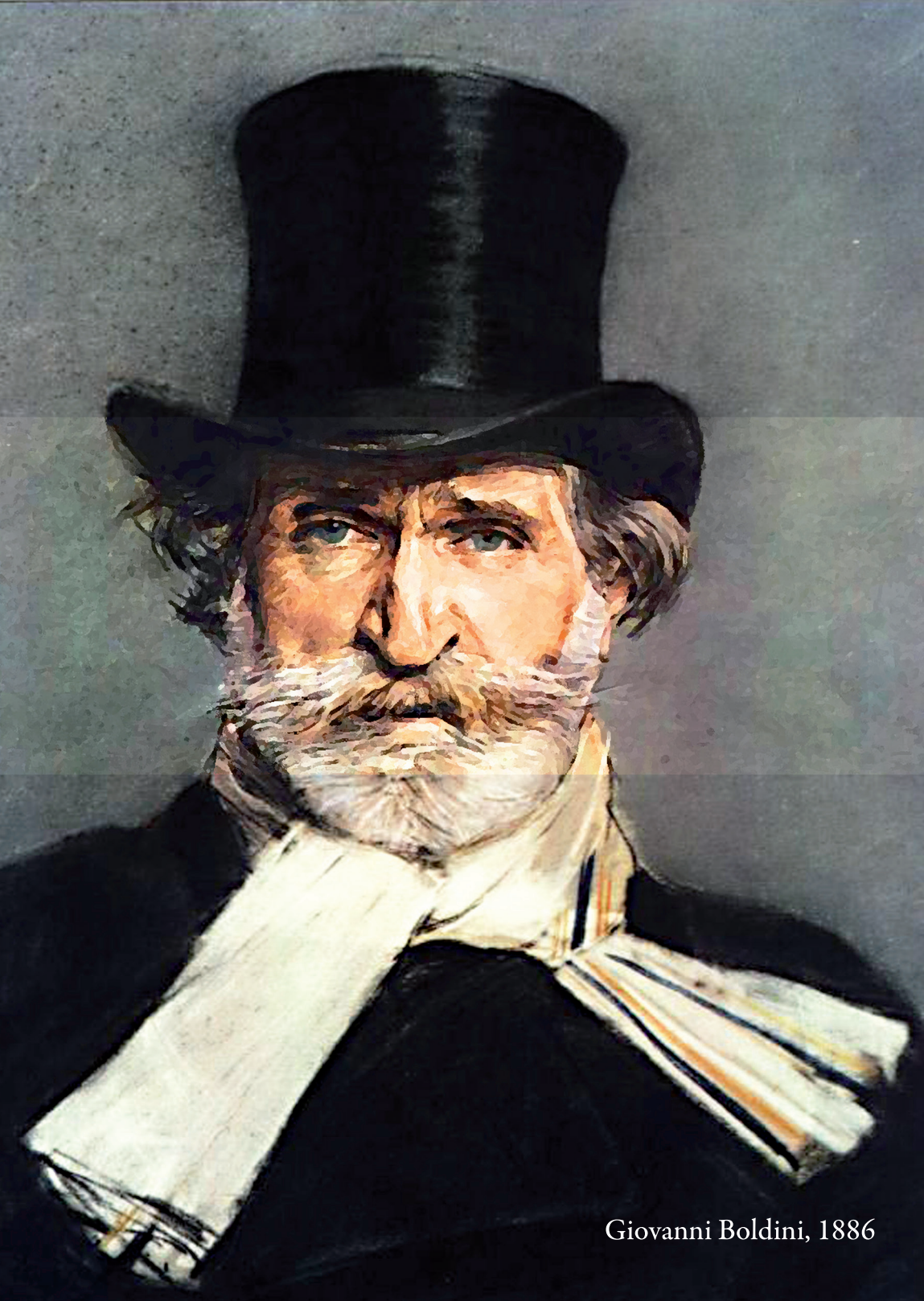
Giovanni Boldini, 1886